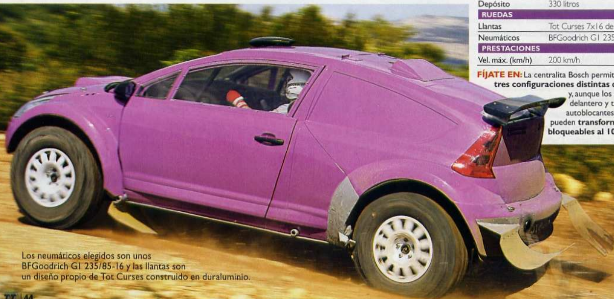
Los neumáticos elegidos son unos BFGoodrich G1 235/85-16 y las llantas son un diseño propio de Tot Curses construido en duraluminio.